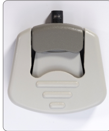
Pédale sans fil