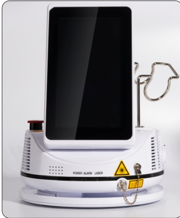
Écran tactile de 7 pouces